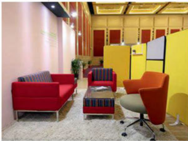
Oasis Furniture Industries Sdn Bhd.

Data: 8-11 marca br. Miejsce: Kuala Lumpur Organizator: UBM Malaysia Edycja: 23. Liczba wystawców: 550 Liczba zwiedzających: 20 tys. osób ze 132 krajów i regionów Następna edycja: 8-11 marca 2018 r.