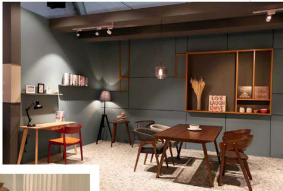
TMH Furniture Industries Sdn Bhd.