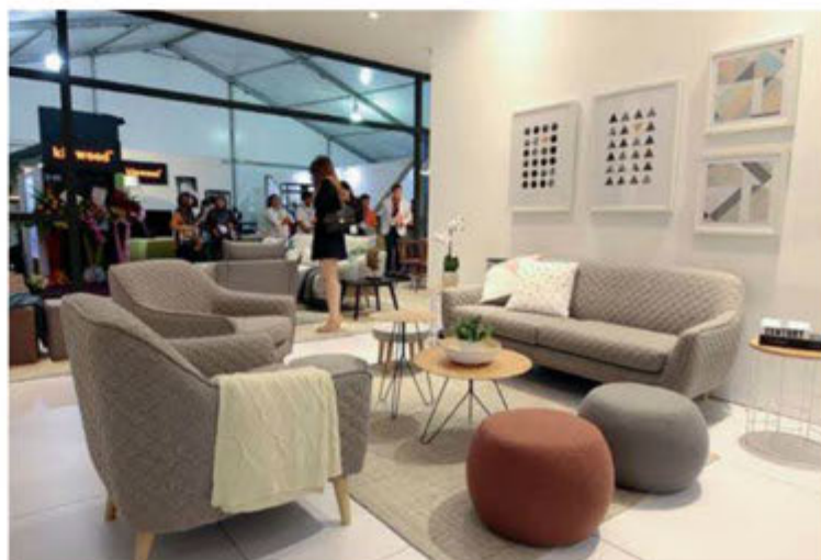
Deesse Furniture Sdn Bhd.