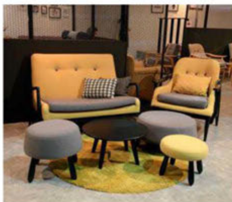
„K1233 Lounge Chair”, „K1232 Loveseat” i otomana firmy Kian Swee Seng Sdn Bhd.